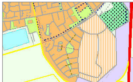
Vector basis met vlakvulling